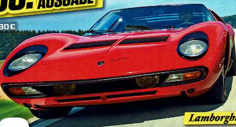
Lamborghini Miura SV